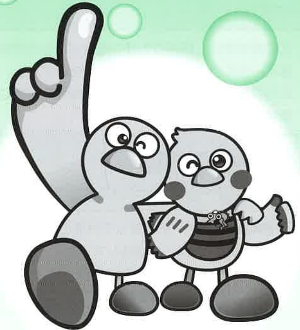
埼玉県のマスコット「コバトン」・「さいたまっち」