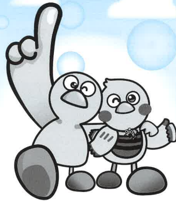
埼玉県のマスコット「コバトン」・「さいたまっち」