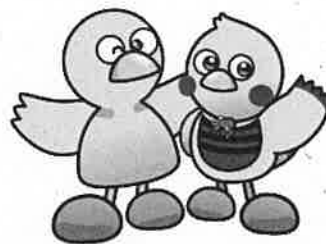
埼玉県のマスコット「コバトン」「さいたまっち」

※ 提出期限後に提出された申請については、認定審査を行いません。奨学金を希望する場合は、期限内に申請書類の提出をお願いします。